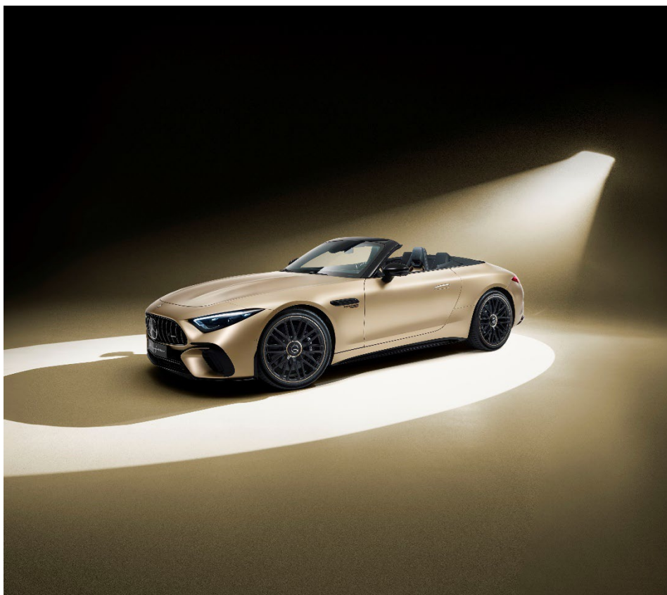
Mercedes-AMG SL 63 MANUFAKTUR Golden Coast

AMGならではの高い走行パフォーマンスを叶える装備に加え、「シートベンチレーター(シートヒーター機能含む)(運転席・助手席)」など快適性を高める装備も充実しており、ロングドライブやオープンドライブもお楽しみいただけるモデルです。